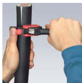
Tourner l'outil pour réaliser une coupe circulaire