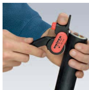
Positionnement de l'outil pour coupe longitudinale