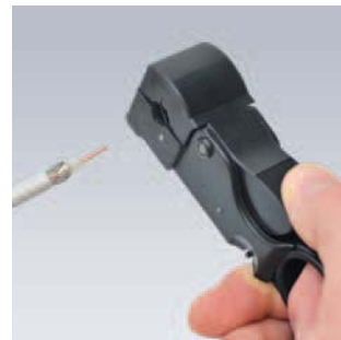
Coupe à trois étapes en une seule opération